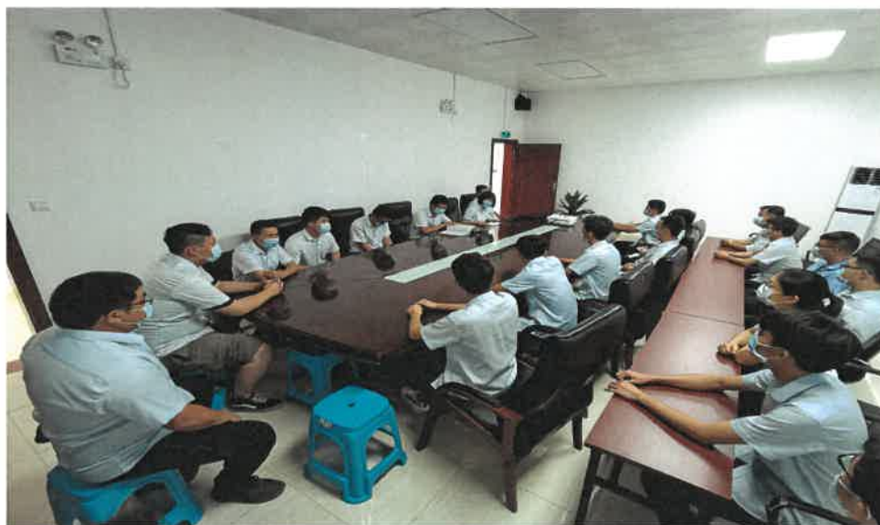
图 2. 员工培训

公司 2021 年底现有员工 30 人，公司为员工提供了良好的工作生活环境，注重加强员工的技能培训教育。公司员工的稳定为公司的安全环保生产提供了坚实的基础。