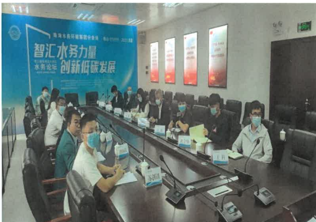
图 3. 积极参加“粤港澳大湾区水务论坛”活动