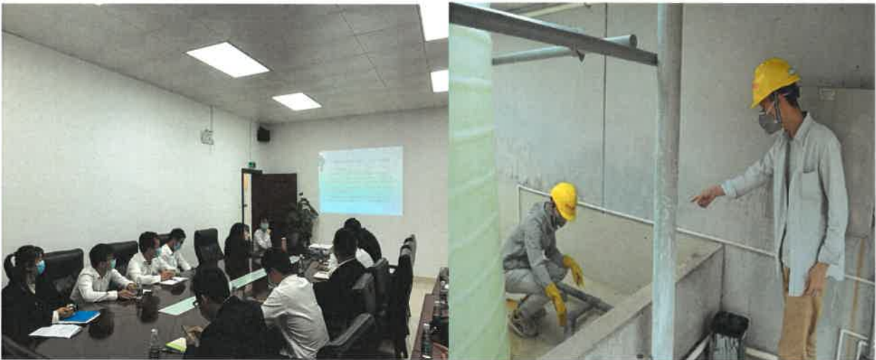
图 1. 组织开展环保应急预案演练

我公司制定的《突发环境事件应急预案》已通过了市环保部门组织的专家评审，并已报送市环保局备案。